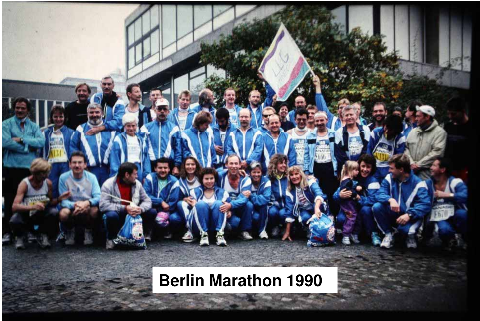
Berlin Marathon 1990